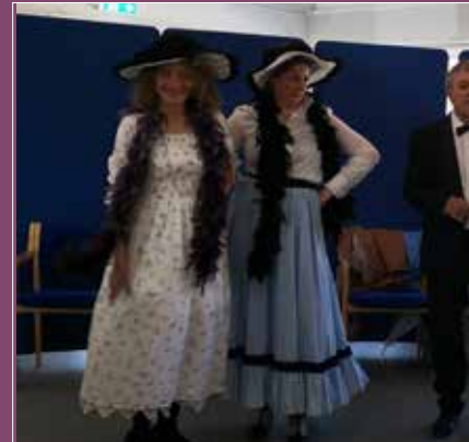
Festlig Cabaret d. 20 juni