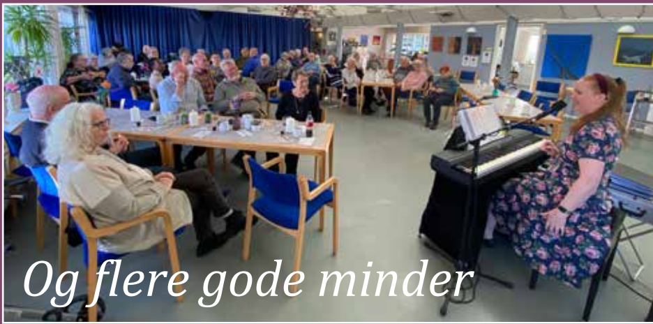
Og flere gode minder