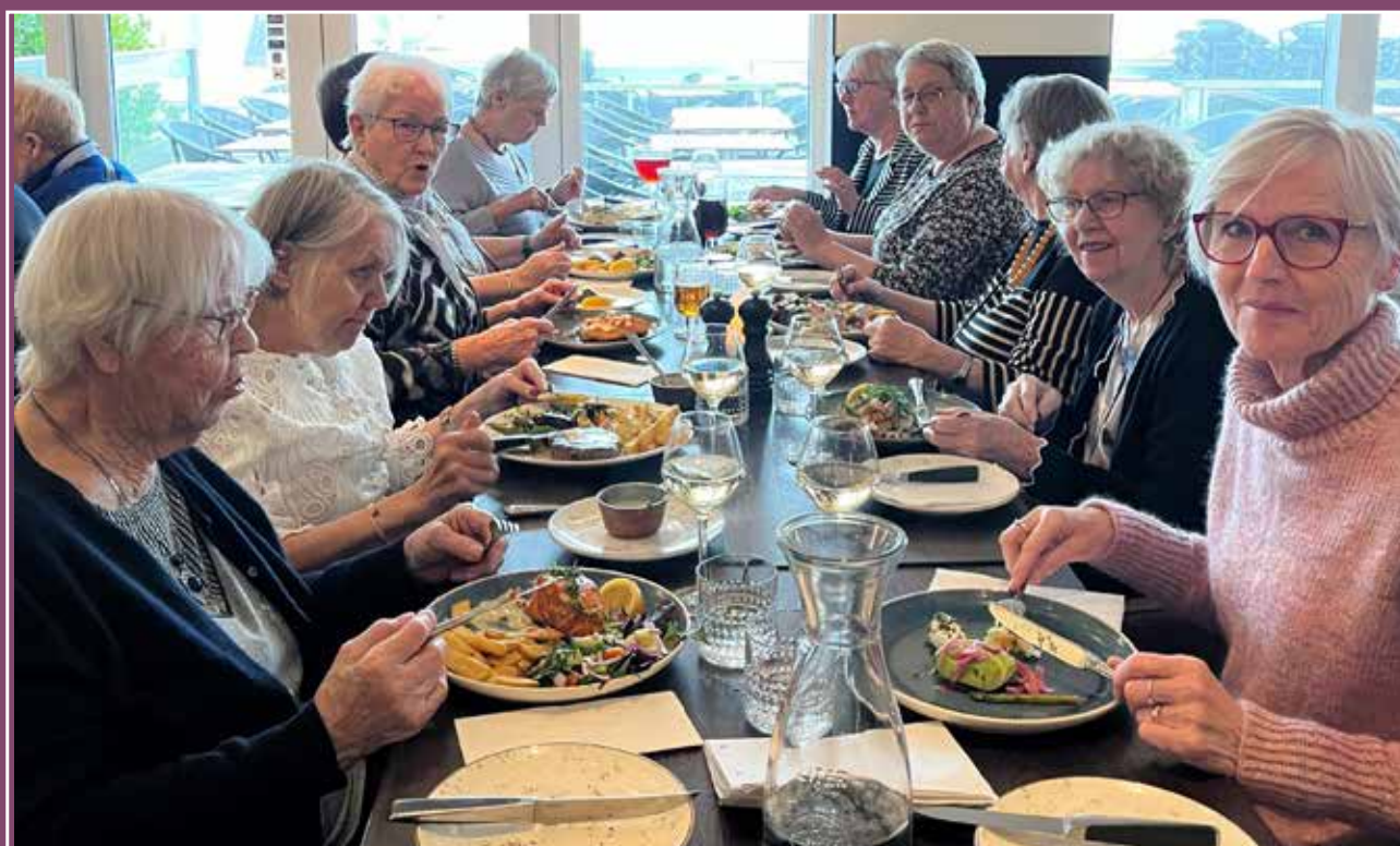
Dametur til Rungsted kyst fra restauranten Kaptajnen