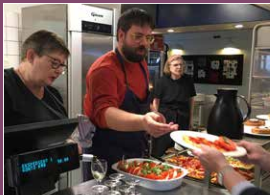
Go mad skal der til ;-p