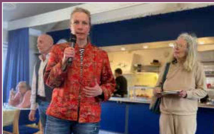
Velkommen til Danmark spiser sammen